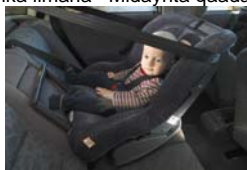
Kursiga ilmaha ee gaariga lagu xiro oo gadaal u jeeda lana bedeli karo