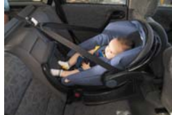
Kaabsulka amaanka ilmaha Midaynta qaadaha/Nooca Kaabsulka