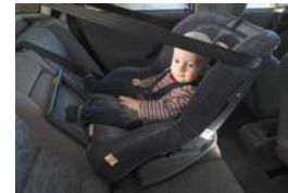
مقعد سيارة للرضيع قابل للتحويل ومتجه للخلف