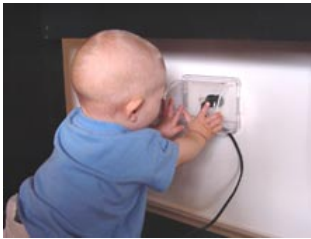
غطاء مقبس كهربائي من نوع Micky HaHa www.mickyhaha.com.au

يجب استخدام أغطية لمقابس وقوابس التيار الكهربائي لحماية الطفل من التعرض لصدمة كهربائية. لا تدع طفلك يضع الأسلاك في فمه.