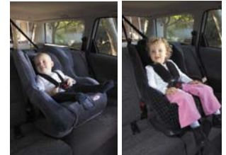
مقعد الأطفال في مرحلة المشي من 8 إلى 18 كغم