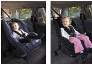
Ghế Nâng Cho Trẻ Mới Biết Đi 8 đến 18 kg