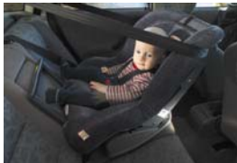
Ghế Nâng Xe Ôtô cho Trẻ Em Có Thể Chuyển Đổi Hướng Ra Phía Sau