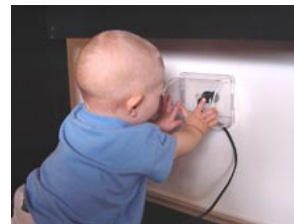
Nắp Dây Ổ Cắm Micky HaHa www.mickyhaha.com.au

Sử dụng nắp đậy ổ cắm và nắp đậy phích cắm để bảo vệ em bé của bạn khỏi giật điện. Đừng để em bé của bạn cho dây vào miệng.