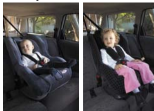
Autosjedralice za malu djecu (Toddler Restraints) 8 do 18kg pribl. 6 mjeseci do 4 godine