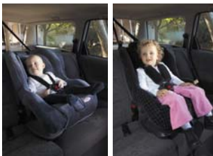
Ghế Nâng Cho Trẻ Mới Biết Đi 8 đến 18 kg Khoảng 6 tháng tới 4 tuổi