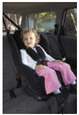
مقعد الأطفال في مرحلة المشي