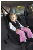
sjedalica za malu djecu 8 do 18kg pribl. 6 mjeseci do 4 godine