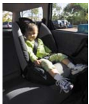
booster sjedalo (pojas ili dječje sigurnosno remenje) 14 do 26kg - pribl. 3 do 8 godina