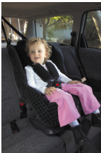
Kursiga lagu xiro gurboodka 8 ilaa 18 Kg Qiyaas ahaan 6 bilood ilaa 4 sanadood