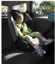
Kursiga xoojiyaha ah (Suunka kursiga ama ilaaliyaha amniga ilmaha) 14 ilaa 26 Kg – Qiyaas ahaan 3 ilaa 8 sanadood