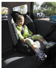
Ghế Nâng (Dây an toàn hoặc bộ dây an toàn cho trẻ em) 14 tới 26 kg - Khoảng 3 tới 8 tuổi