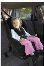
Ghế Nâng Cho Trẻ Mới Biết Đi 8 đến 18 kg Khoảng 6 tháng tới 4 tuổi